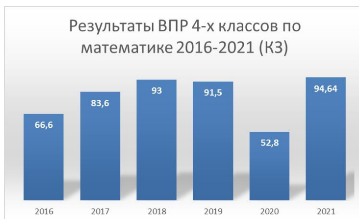
Диаграмма 4. Результаты по математике.

Данные диаграммы 2 показывают высокий уровень показателей, обучающихся 4-х классов по математике.