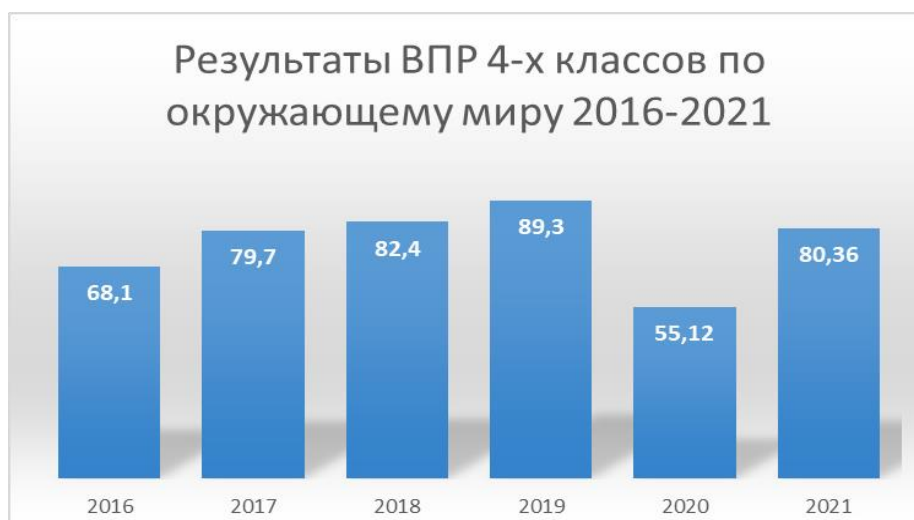
Диаграмма 5. Результаты по окружающему миру.

Данные диаграммы 2 показывают высокий уровень показателей, обучающихся 4-х классов по математике.